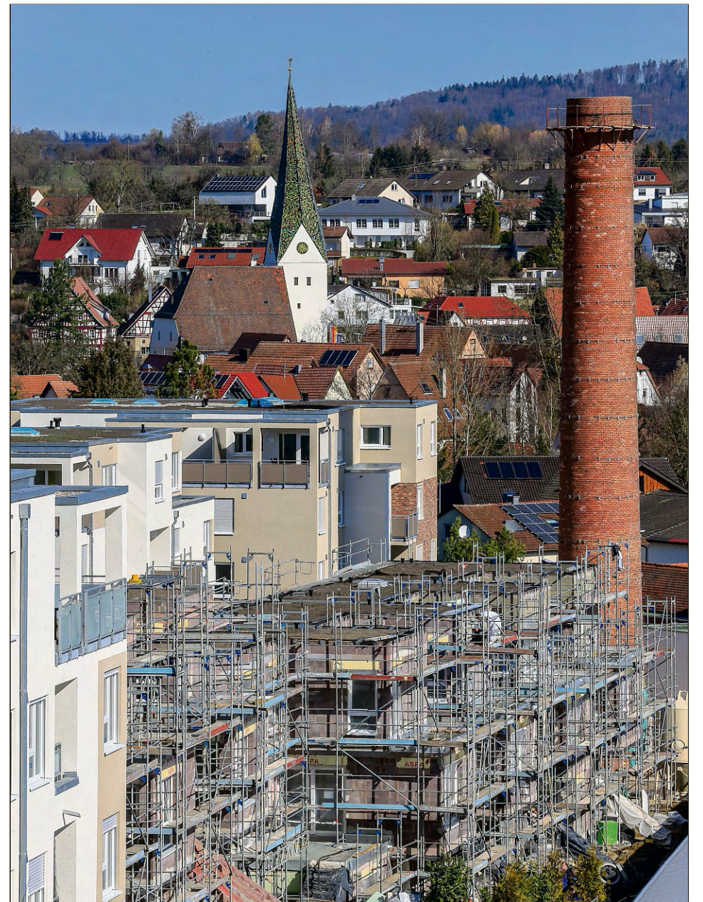
Das neue Rombold-Areal mit seinen Wohnungen und Gewerbeflächen: Es erweitert den Aktionsradius der Weissacher Gewerbeschau. Die ersten Firmen sind dieses Mal mit dabei.

Weitere Informationen und alle Teilnehmer gibt es auf der Internetseite www.fleckaschau.de . Hier sind auch zahlreiche Impressionen aus den vergangenen Jahren zu sehen.