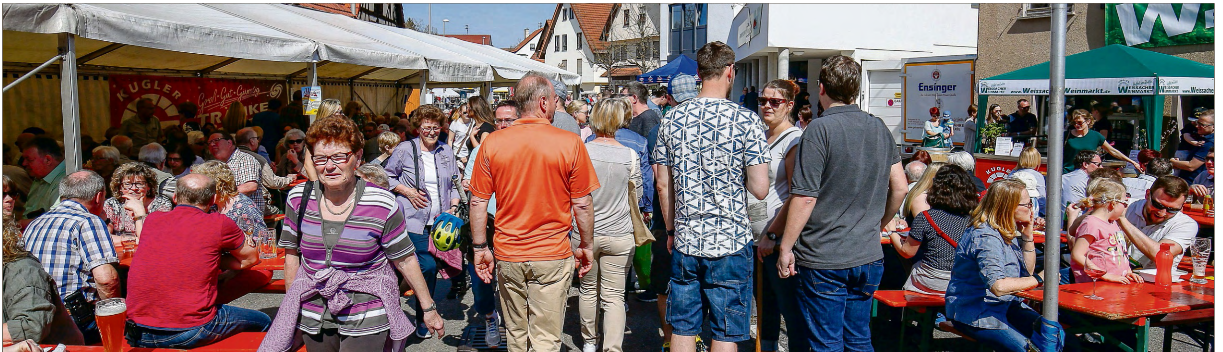
Für das leibliche Wohl ist genauso gesorgt wie für den Hunger nach gewerblicher Information und Wissensdurst rund um die heimischen Betriebe: Die Fleckaschau zieht jedes Jahr Tausende Besucher ins Weissacher Tal.