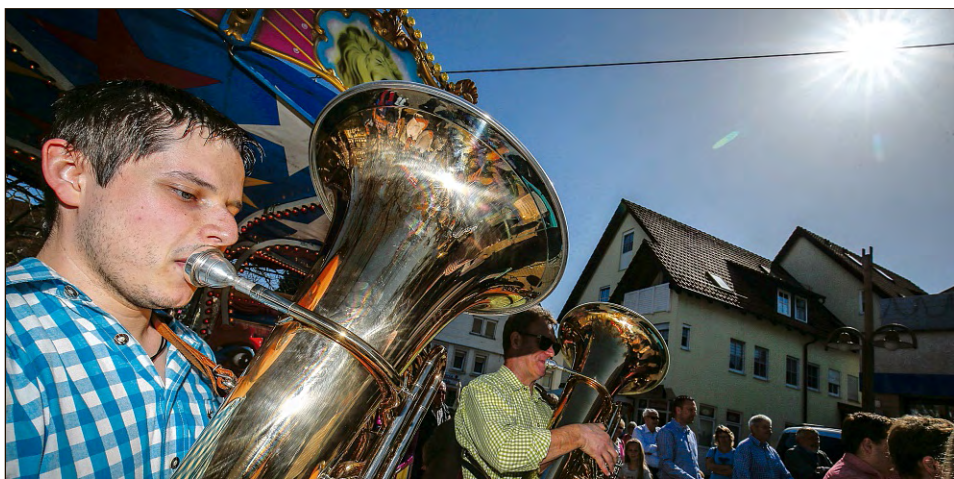
Ständchen im Sonnenschein: So strahlend wurde die Fleckaschau im vergangenen Jahr eröffnet.