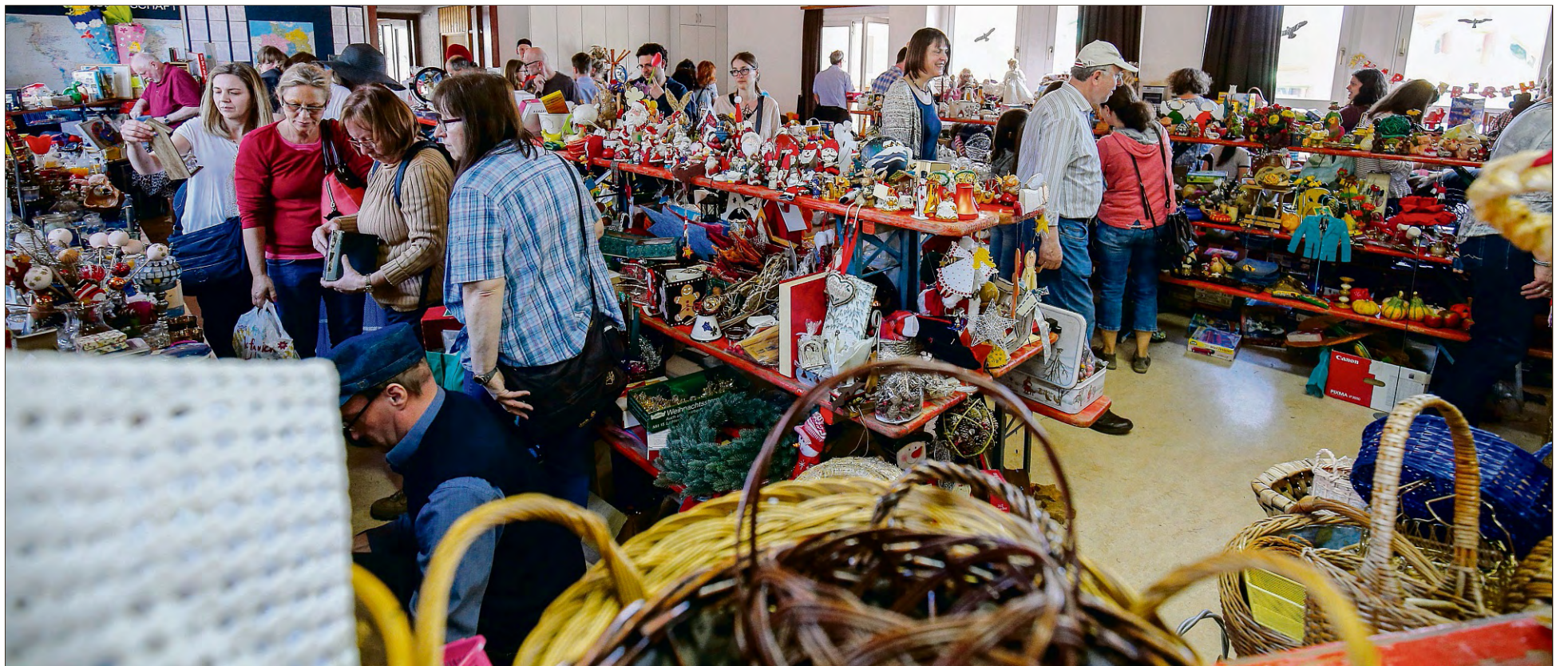
Warenhalle statt Unterrichts- oder Andachtsraum: Schüler verwandeln das Gebäude der Evangelischen Missionsschule alljährlich zur Fleckschau in einen riesigen, sortierten Flohmarkt.

Handel, Dienstleistung und Gewerbe des Weissacher Tals präsentieren an der Fleckschau ihr attraktives Angebot. Es kann nach Herzenslust eingekauft, geschaut, gestaunt und geschlemmt werden. Für das leibliche Wohl wird bestens gesorgt und die teilnehmenden Betriebe warten mit attraktiven Angeboten auf. Zahlreiche Attraktionen für Kin-