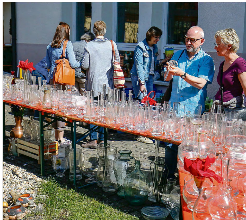
Die Flohmarktbesucher finden die Sachen thematisch sortiert: Vasen, Übertöpfe und Pflanzenkübel finden sich im Freigelände. Bücher, Kleidung, Elektrogeräte und Spielsachen sind in der Schule.